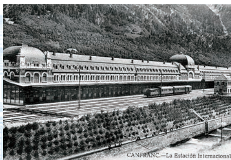
CANFRANC.—La Estación Internacional Foto: "Canfranc. El mito"

La Estación Internacional de Canfranc fue el complejo ferroviario español más importante de los construidos en nuestro país durante el primer tercio del siglo XX y el segundo de Europa, tras la estación alemana de Leipzig. Las medidas y números de su edificio central así lo reflejan: 241 metros de longitud, una anchura de 12 metros y medio, 75 puertas por cada lado y tantas ventanas como días tiene un año, 365.