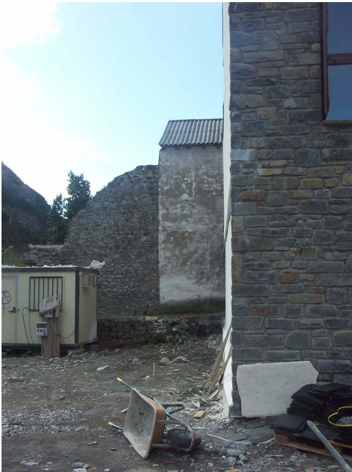
Figura 3. Imagen de la parte del pajar inicialmente incluida en la UE-3. En primer plano, bloque de viviendas VPO, promovido por SVA y recientemente entregado.