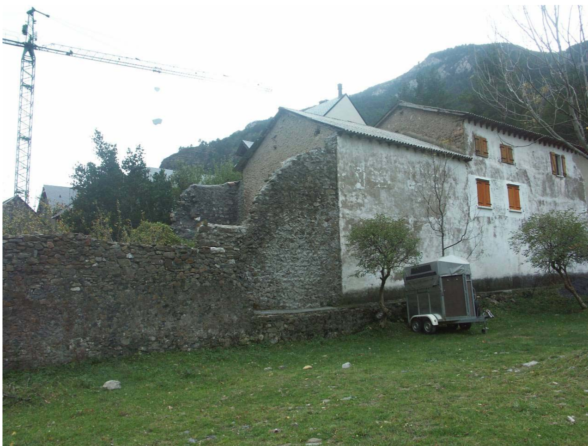
Figura 1. Imagen de la edificación afectada, donde se observan los dos elementos que la componen, vivienda y pajar. La imagen es previa a la construcción de un bloque de viviendas VPO recientemente entregado, que ahora oculta parcialmente el conjunto.

Inicialmente el Plan definía tres situaciones diferentes para la edificación. La parte correspondiente a la casa se incluye dentro del área de movimiento de la edificación, Zona de Casco histórico, incluyéndose entre los edificios catalogados con el nivel de Protección ambiental, grado 2. El resto de la edificación, la correspondiente al pajar, se repartía entre el suelo urbano no consolidado, dentro de la unidad de ejecución UE-3 y el suelo urbano consolidado, zona de Casco histórico, aunque fuera del área de movimiento de la edificación.