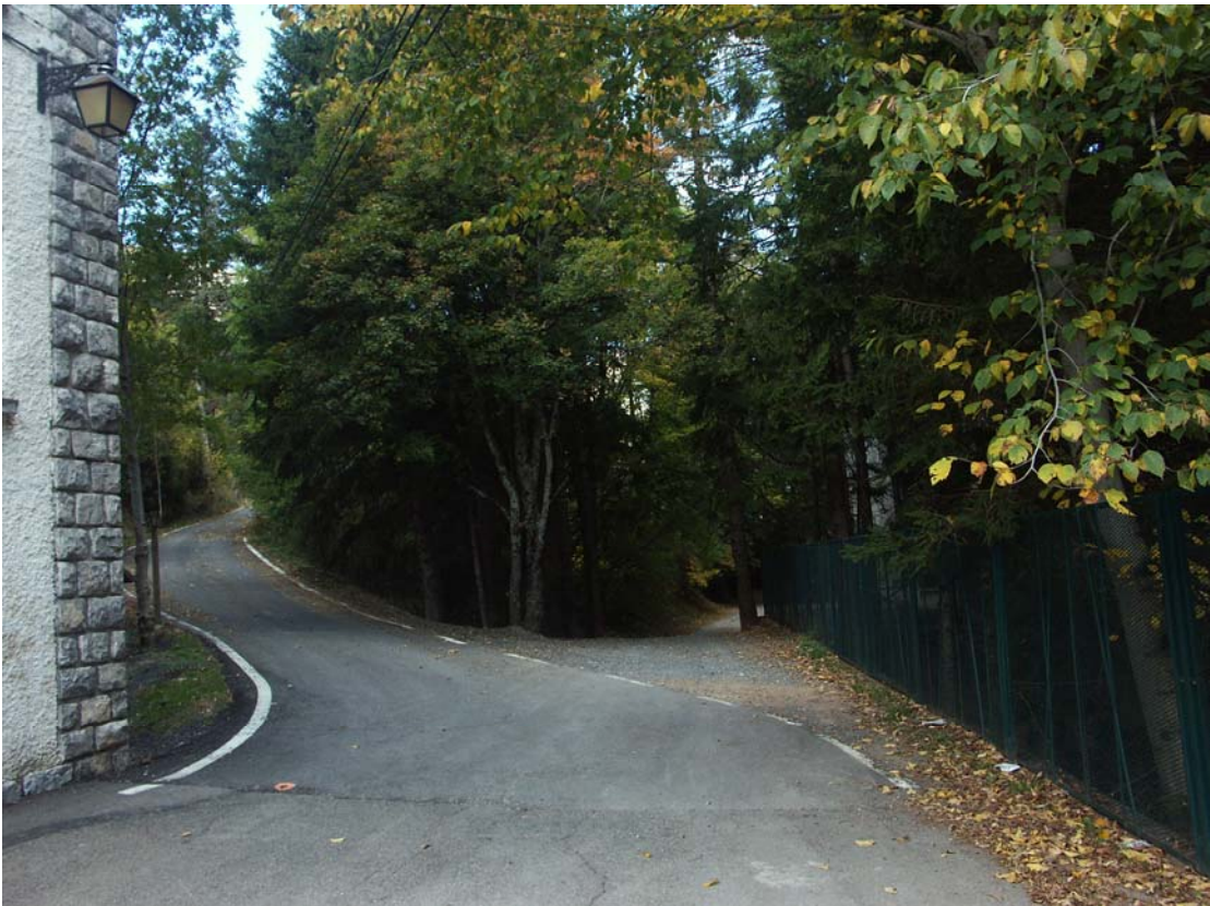
Figura 3. Paseo de los Ayerbe.