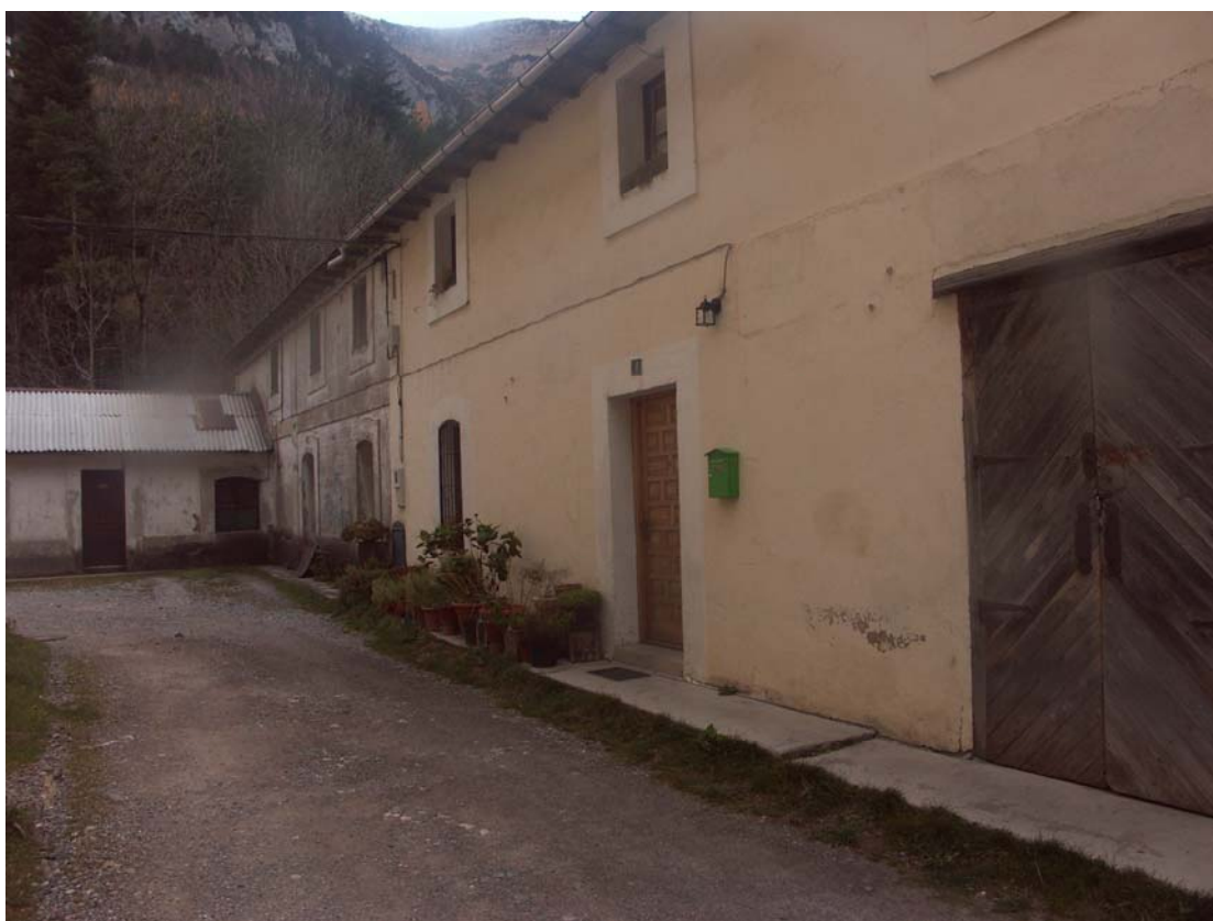
Figuras 11 y 12. Situación actual Edificio D.