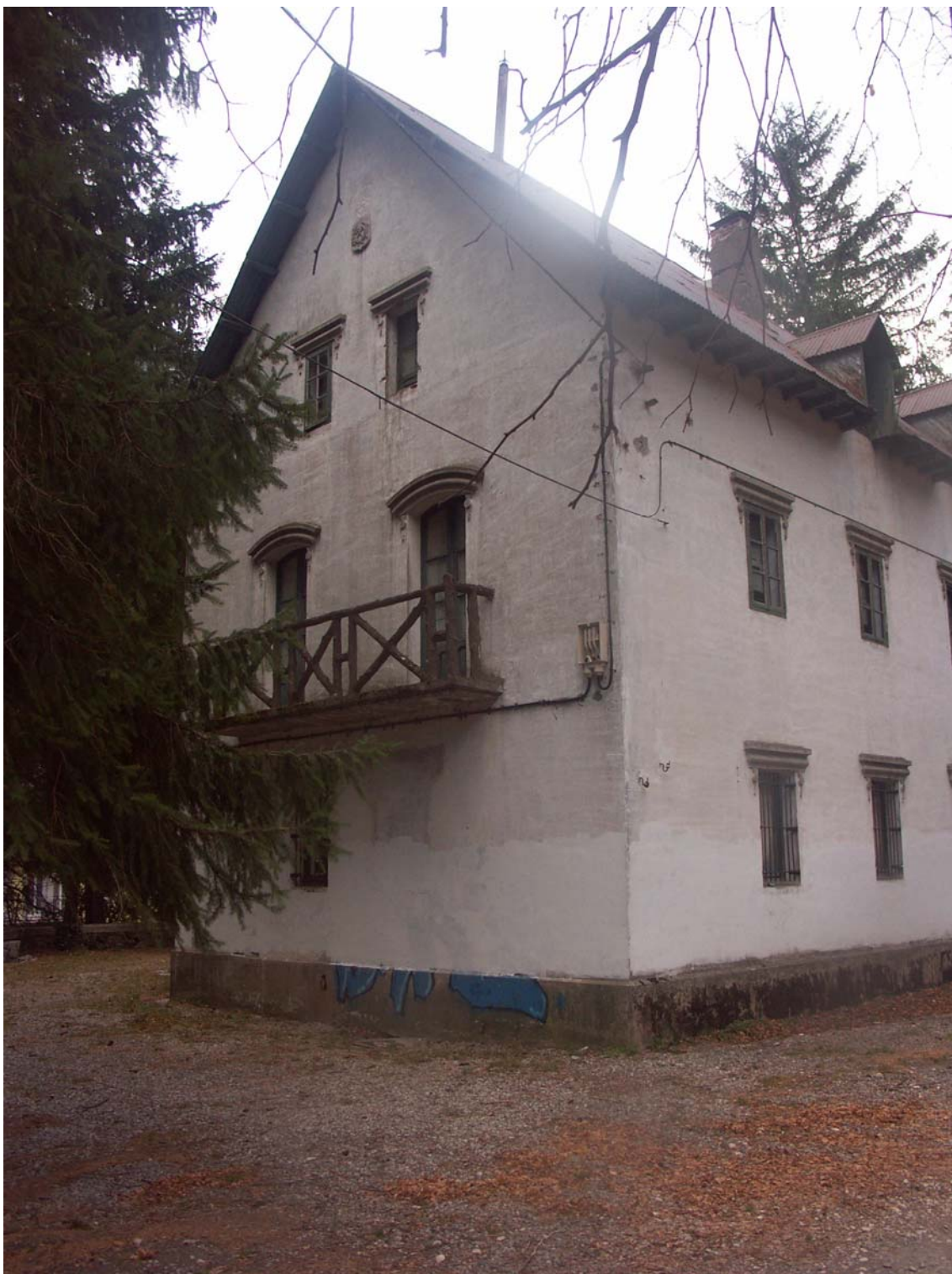
Figura 8. Situación actual Edificio A.