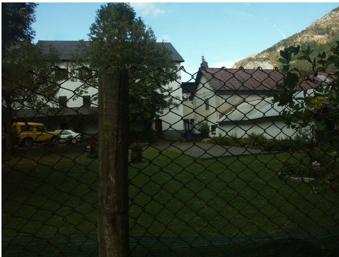
Figura 4. Edificios de Forestales.

Igualmente necesaria se considera la protección de los edificios de mayor interés arquitectónico del conjunto, ninguno de ellos incluido en el catalogo de edificios de interés histórico artístico del PGOU de Canfranc. El grado de protección se adapta al interés real de cada edificio. Para ello se han seguido las pautas del borrador de catalogo de edificación protegida de Canfranc Estación, encargado en el 2004 por el Ayuntamiento de Canfranc, elaborado por el estudio de arquitectura y urbanismo CeroUno y nunca tramitado.