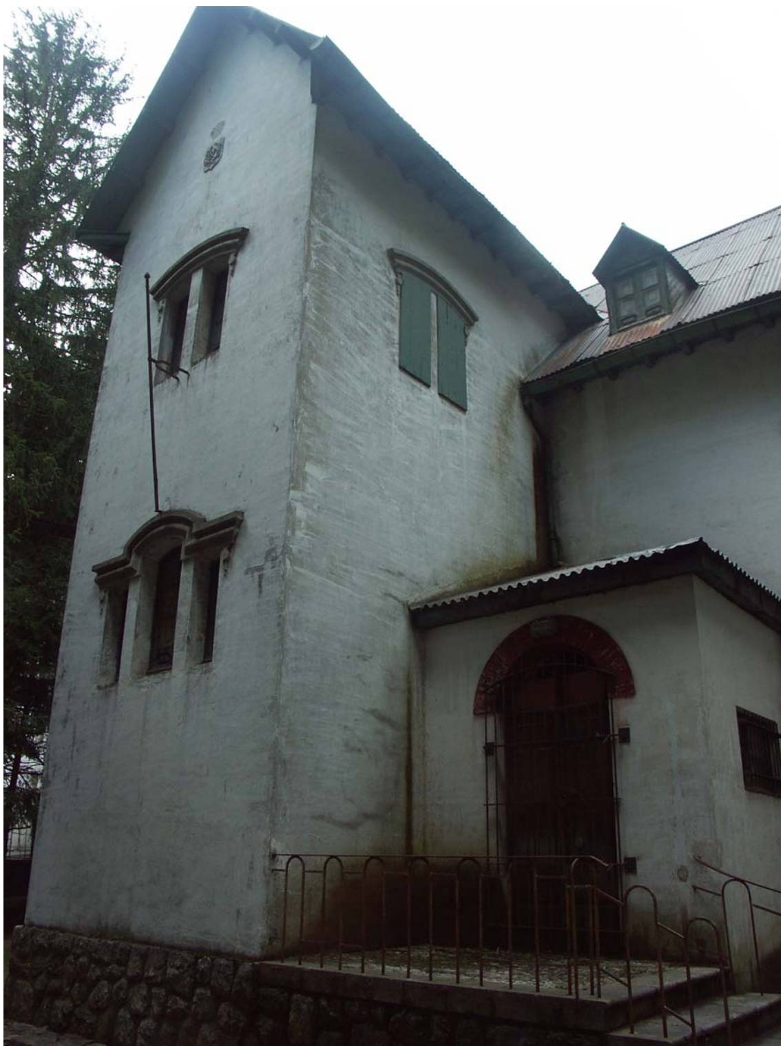
Figura 5. Edificios de Forestales.