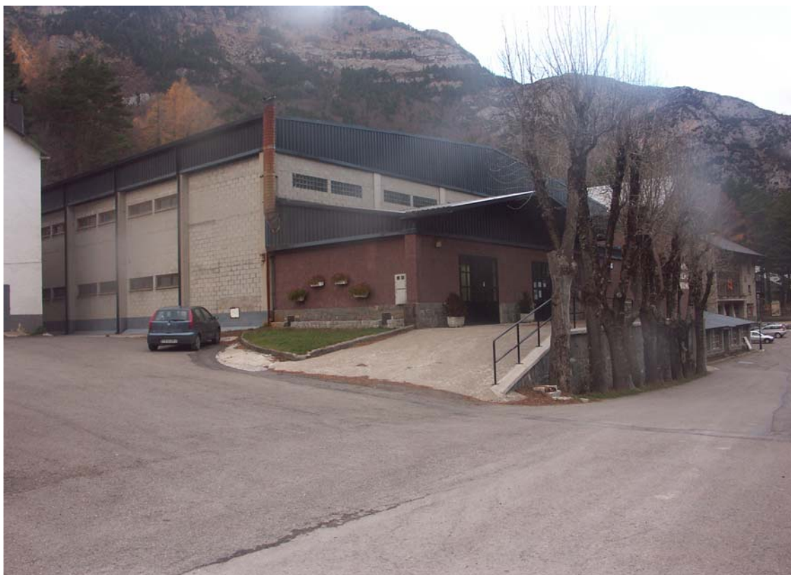
Figura 7. Pabellón Polideportivo Municipal.

Se incluye el pabellón municipal entre los sistemas generales de equipamiento deportivo, sin resultar necesario modificar las condiciones de volumen definidas en el PGOU de Canfranc para el sistema general dotacional.