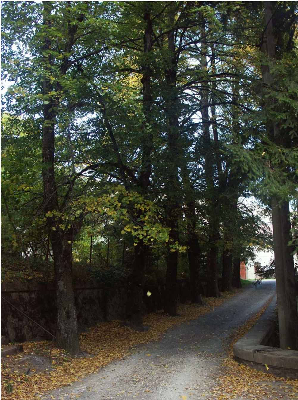
Figura 6. Tilos de Forestales.

Se propone la protección directa de los ejemplares más notables, los siete ejemplares de tilos en el margen del vial que atraviesa el área, y un abeto de grandes dimensiones sito en el interior del área edificable. Para el resto de la zona arbolada se plantea una protección genérica, potestativa de los servicios técnicos municipales.