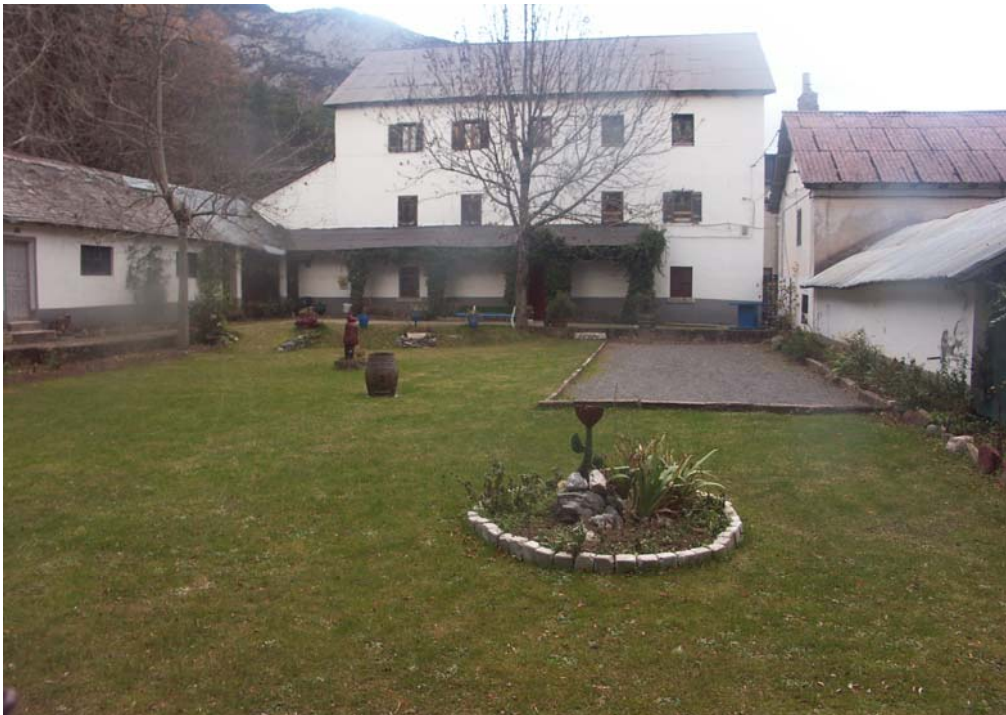
Figuras 9 y 10. Situación actual Edificio C.