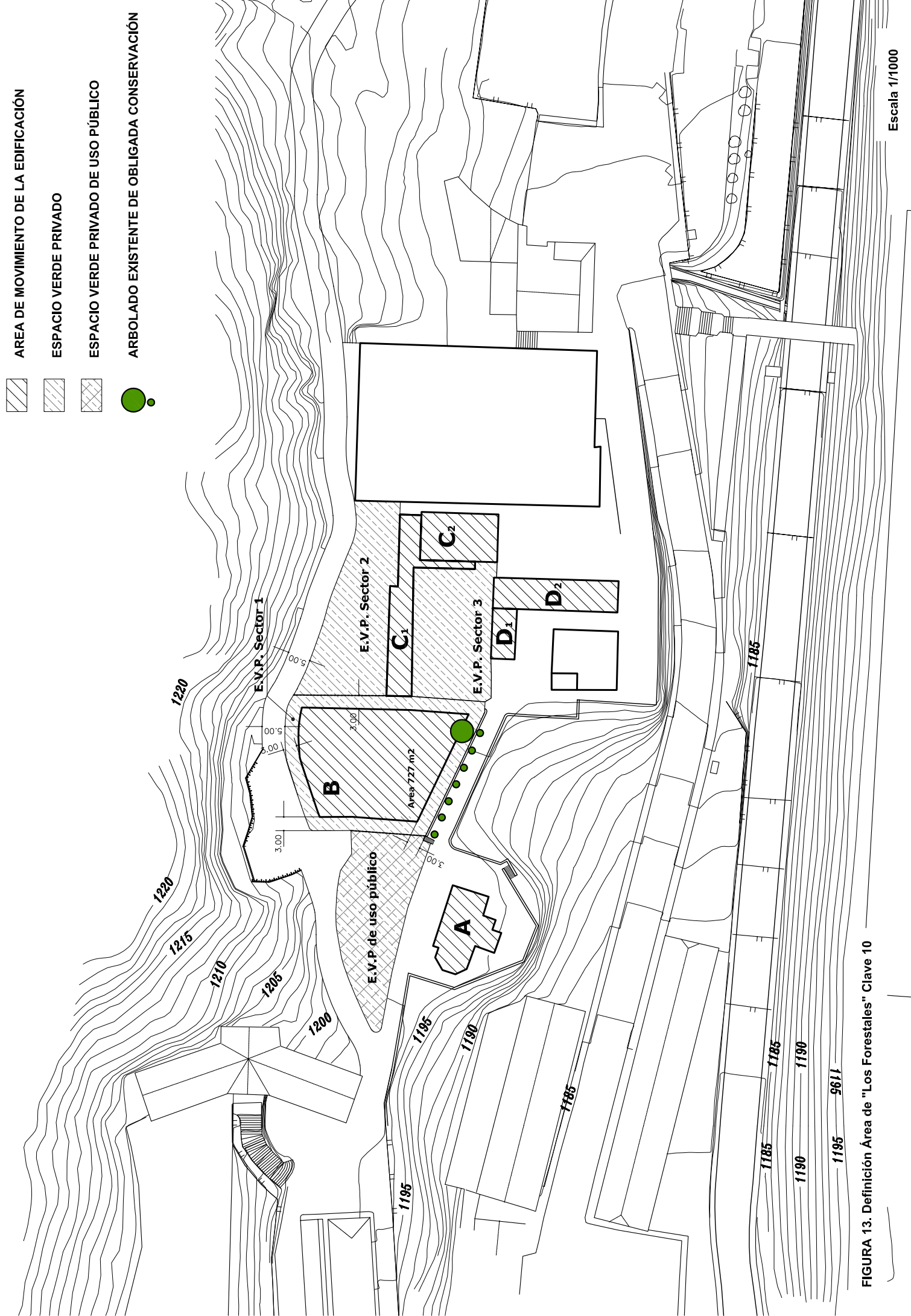
FIGURA 13. Definición Área de "Los Forestales" Clave 10